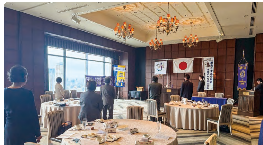
▲2025年最後の『また会う日まで』。皆さん元気にまた来年! よいお年をお迎えください。