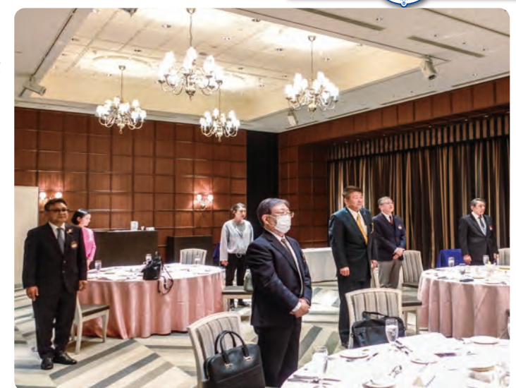
▲本日もピシッと姿勢が美しい大阪南LCの面々。 忙しい毎日の中、例会は安らぎのひと時です。