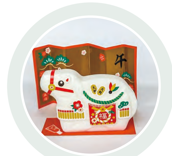
▲L伊東より、来年の干支である午の置物をプレゼント。せっけんのいい香りです。