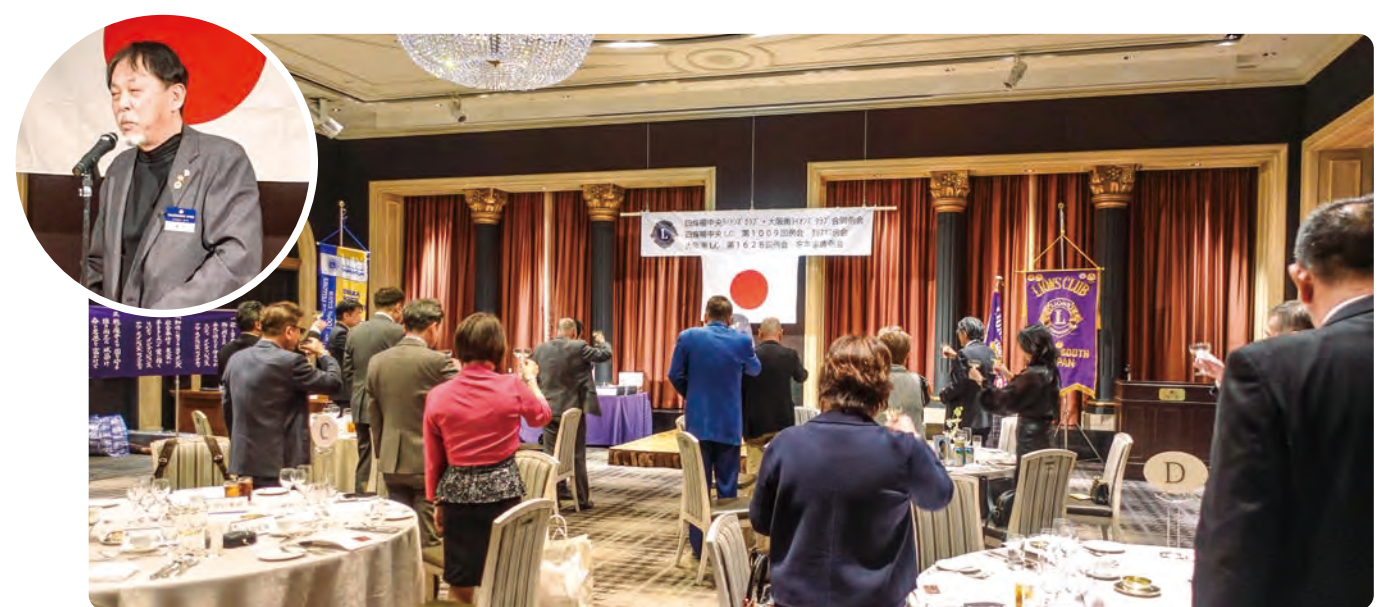
▲みらいへコーディネーターL下農のご発声で、1年の労をねぎらい、更なる発展を祈念して 盛大に乾杯!