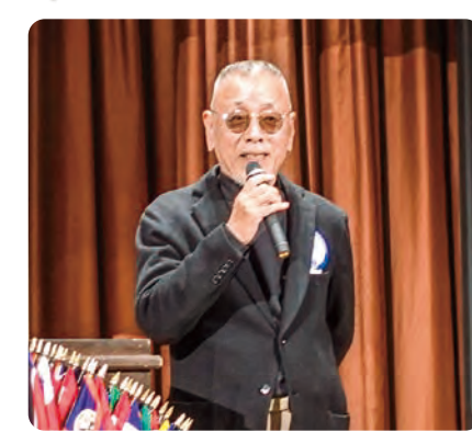
▲みらいへ委員長(下津LC) L北野