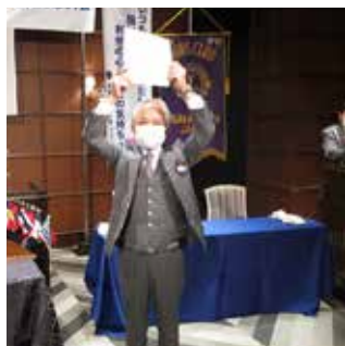
L吉田之計に 20年在籍者表彰 贈呈