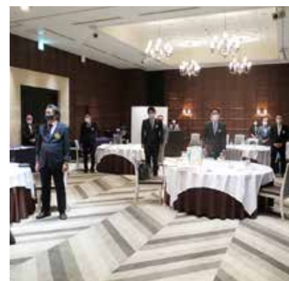
また逢う日まで斉唱のメンバー