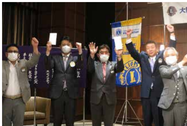
グッドスタンディング賞表彰