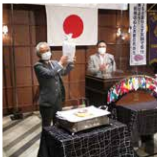
L吉田之計にお誕生祝贈呈