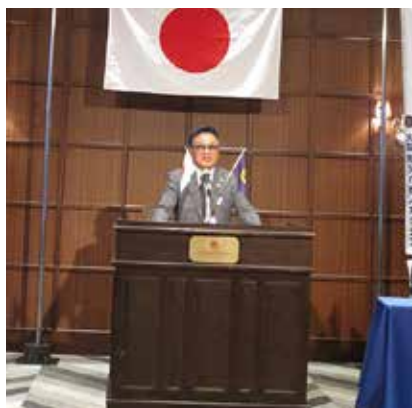
4R1Z ZC 鳥山雅庸 ご挨拶