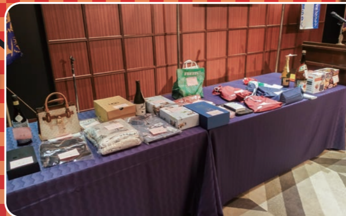
メンバーが持ち寄った豪華な品々が並びます。

忘年家族会恒例のチャリティオークションが開催されました。次々と登場する逸品(中には珍品?)の数々に競い合うように手が上がり、大盛り上がりとなりました。売上は全額ドネーションされました。