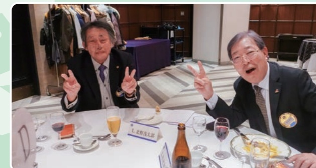
▲素敵な笑顔と一緒に元気なピースを見せてくれました。