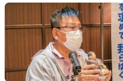
◀ L鳥山によるスピーチでは仙台に伝わる福の神を紹介してくれました。実在の人物が由来となっており、縁起の良い置物がL金に贈られました。