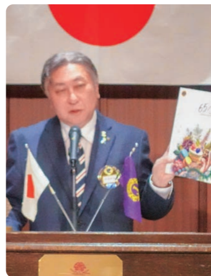
▲大阪南LC 65周年記念誌が完成したことが会長より報告されました。65年の歴史を紡いだ一冊にメンバー一同読み入っていました。