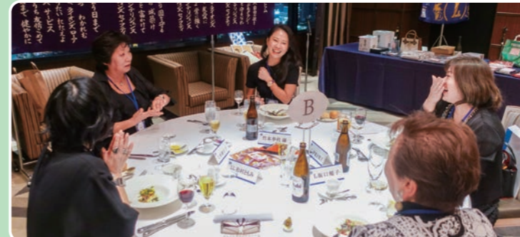
▲いつもメンバーをサポートして下さるライオンレディの皆様。