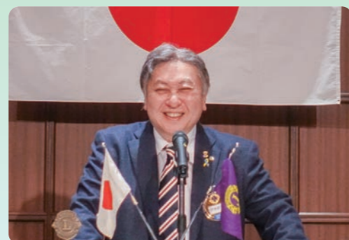
▲最後に会長より閉宴の挨拶。楽しい会を象徴する弾けるような笑顔です。