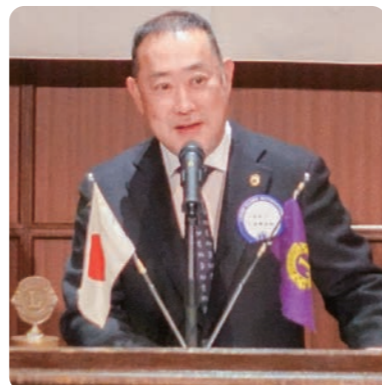
▲ビジターとして出席された大阪港LCのL金岡よりご挨拶をいただきました。