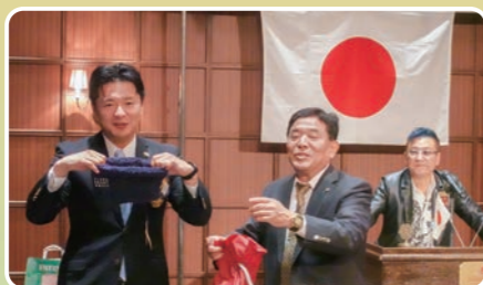
▲L鳥山、L西堀のコンビが小気味よくオークションを進行し、次々と品物が落札されていきます。