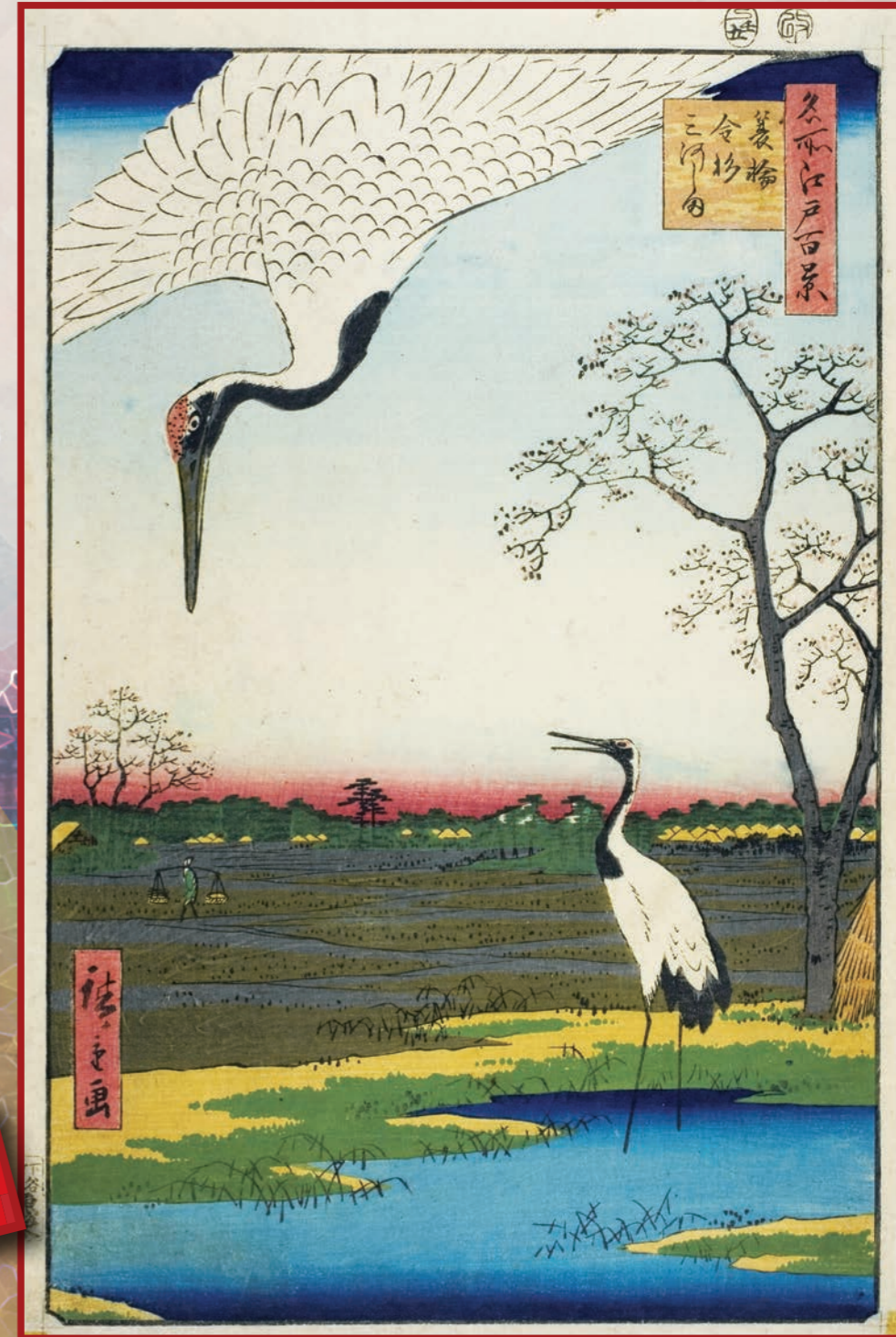
名所江戸百景より 「箕輪金杉 三河しま」

本号が出るのは正月が明けてからのこと。新年号というわけです。本来ならお祝い気分一色となるところですが、元旦の夕暮れ時、能登を襲った震度7の大地震。被災された方々には心よりのお悔みを申し上げる次第です。地震大国と言われる我が国ですが、地震だけは予測がつかず一瞬にして暮らしが一変する事態となってしまいます。大地震のあとよく聞かされるのが、実はこのような前兆があったというもの。時期までは特定出来ないといえども、丁寧に注意喚起をしてくれてもいいのではないかと思います。それなりの備えができるに違いありません。そして二日目には羽田での大事故。JAL機の乗客全員が助かったのは、不幸中の幸い。奇跡です。とかく辰年は激しい年ともいわれられており、振り落とされないように覚悟だけはしておいてもらいたいと願っています。